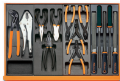
T153 T138 T145 T236