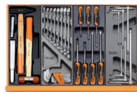
T234 T33 T208 T68