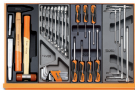
T234 T33 T208 T68