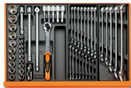
T80 T05 T06